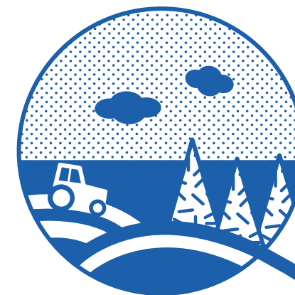
tereny zieleni: (np. rolne, leśne, parkowe lub ogródki działkowe)