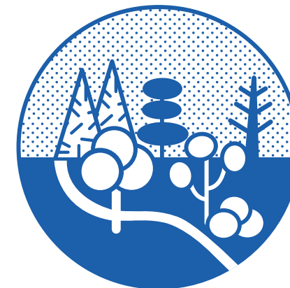
niezabudowane (np. las lub park)