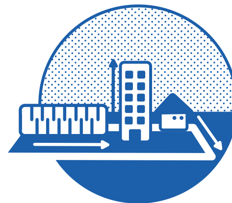
zabudowa: (np. powierzchnia zabudowy, gabaryty)