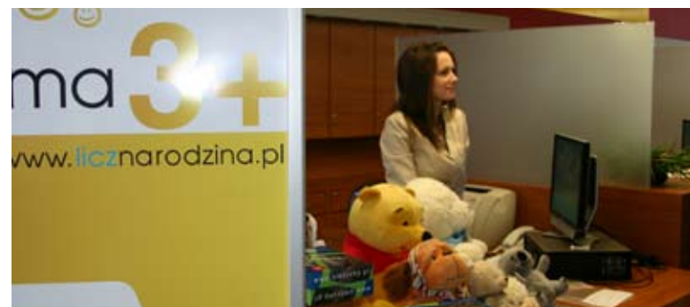
W dniu inauguracji programu dzieci z rodzin 3+ oprócz karty rabatowej otrzymały też maskotki i pamiątkowe gadzety związane z 75-leciem miasta.

Wniosek o kartę rabatową można złożyć w każdej chwili w Biurze Obsługi Klienta na parterze UM Tychy. Kartę otrzymają rodziny z co najmniej trójką dzieci, rodziny zastępcze oraz podopieczni Ośrodka Usług Opiekuńczo-Wychowawczych.