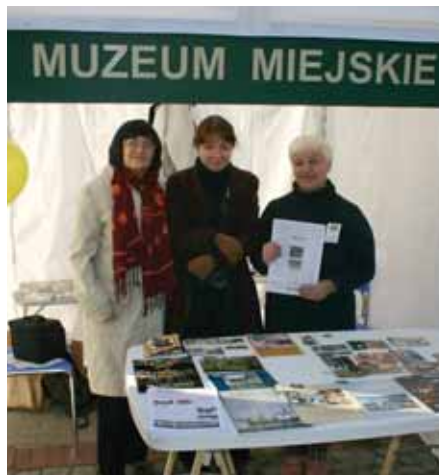
Stoisko Muzeum Miejskiego w Tychach