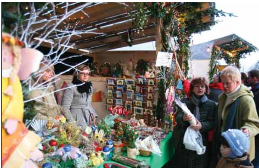
Stragany z ozdobami przyciągną znów zapewne wielu tyszan

9 grudnia w biurowcu Balbina Centrum przy ul. Barona po raz trzeci pojawią się anioły. Wtedy właśnie odbędą się Targi Twórczości Osób Niepełnosprawnych, którym, jak co roku towarzyszy hasło: „W dobrym TTON-ie być Aniołem”.