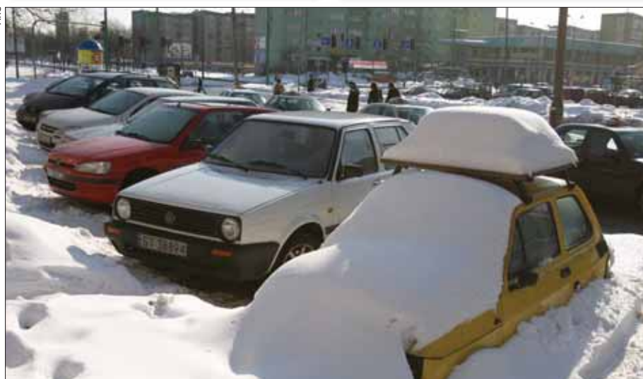
Czy tej zimy często będziemy oglądać takie obrazki?