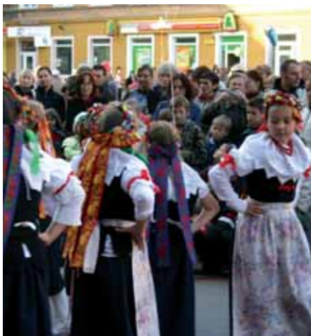
Występ dzieci z SP nr 3