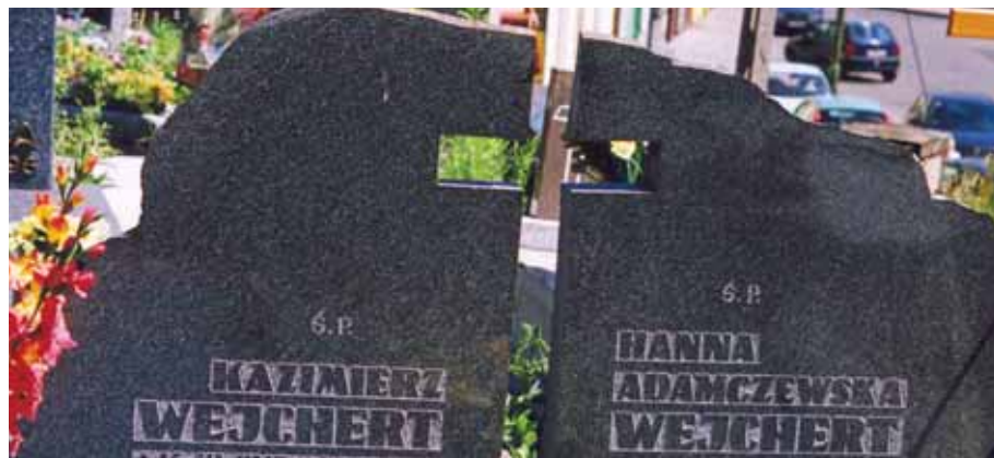
Główni projektanci Tychów spoczywają na cmentarzu przy kościele św. Marii Magdaleny