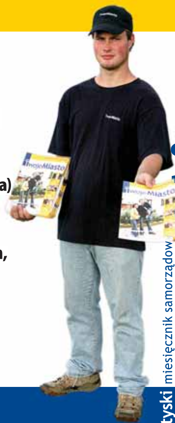
tyski miesięcznik samorządowy