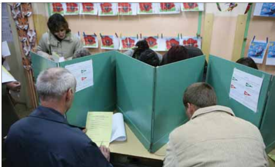
Ruch w lokalach wyborczych był spory

Czternaście godzin, 66 komisji, ponad 105 tys. uprawnionych i prawie 64 tys. głosów ważnych. Prawie dwie trzecie tyszan poszło 21 października do urn. W mieście wygrała Platforma Obywatelska.