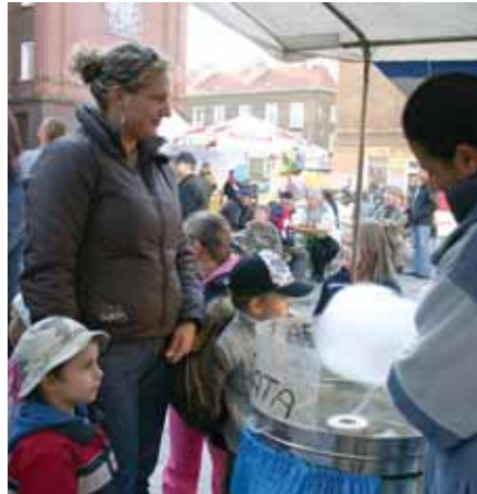
Wata cukrowa – jak 55 lat temu