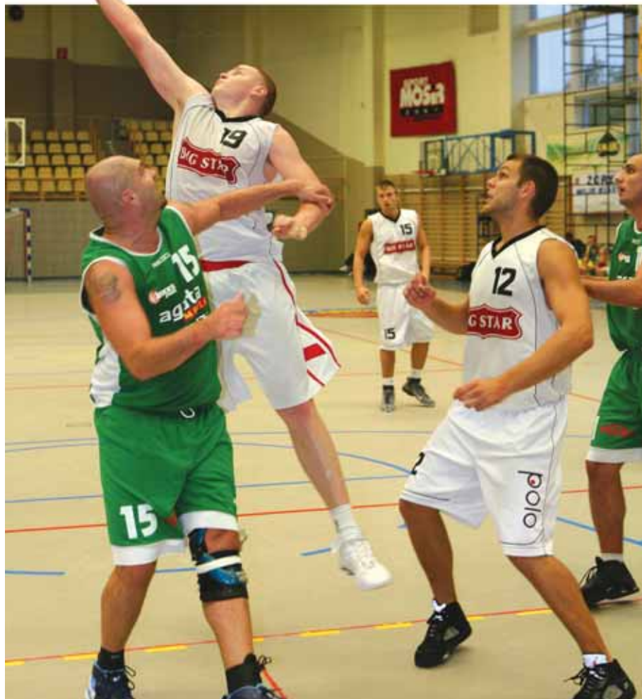
Big Star walczy o dobre lokaty w I lidze

– Prawdziwi fani Big Stara chcą oglądać mecze koszykówki na wysokim poziomie, z dużą dawką emocji i co najważniejsze wygrane! Przetasowania w drużynie musiały się