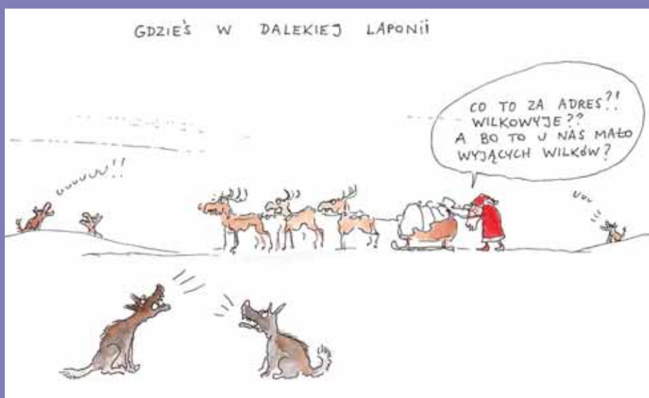
Rysuje JAROSŁAW RĄCZKA