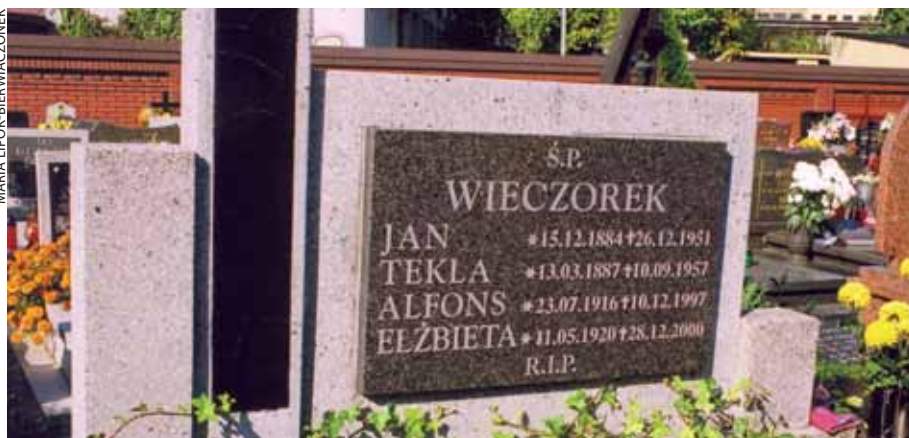
Grób rodziny Wieczorków na cmentarzu przy ul. Nowokościelnej

Tekst i zdjęcia: MARIA LIPOK-BIERWIACZONEK