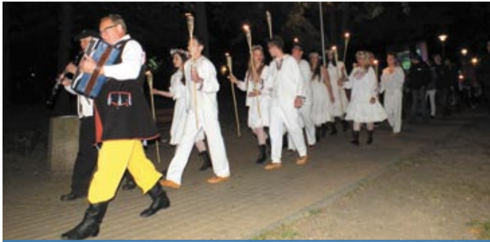
Po zapadnięciu zmroku, nad jezioro wyruszy parada świętojańska – korowód dziewcząt z wiankami na głowach i chłopców z pochodniami. Każdy będzie mógł do nich dołączyć. Nad jeziorem wianki zostaną puszczane na wodę.

W ZESZŁYM ROKU W TYCHACH PO RAZ PIERWSZY ODBYŁA SIĘ IMPREZA NAWIĄZUJĄCA DO TRADYCJI I OBRZĘDÓW NOCY ŚWIĘTOJAŃSKIEJ – TYSKIE WIANKI. SPODOBAŁA SIĘ TYSZANOM, WIĘC I W TYM ROKU POWITAMY LATO NAD JEZIOREM PAPROCAŃSKIM W KLIMACIE STAROSŁOWIAŃSKIEJ SOBÓTKI.