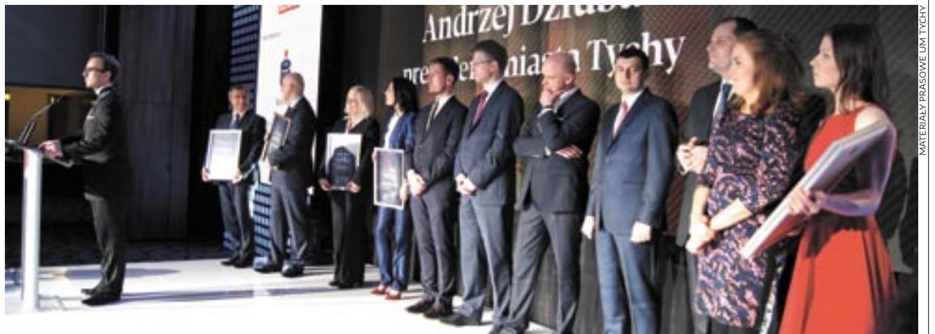
Prezydent Tychów odebrał nagrodę podczas uroczystej gali w Warszawie.

Filary Polskiej Gospodarki to ranking przygotowany przez czołową agencję badawczą przy współpracy z redakcją dziennika „Puls Biznesu”. Samorzady terytorialne jako organy władzy zlokalizowane zarówno najbliższe lokalnych przedsiębiorców, jak i społeczności, poprzez swoje głosy decydują o wyborze zwycięzców plebiscytu w poszczególnych województwach. OPRAC. SW