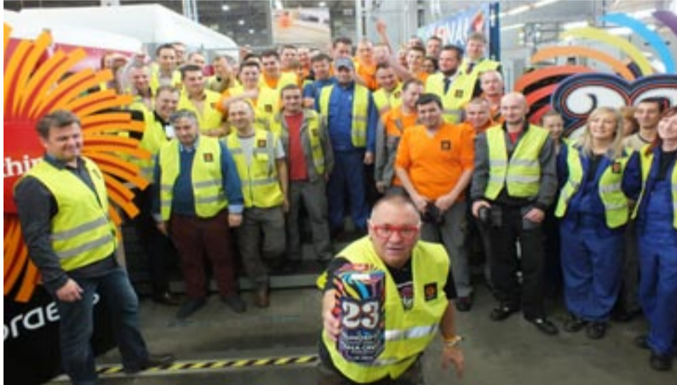
Jerzy Owsiak z załogą tyskiego zakładu Stora Enso Poland, który produkuje skarbonki na 23. Finał WOŚP.

OD 17 LAT PRODUCENTEM I OFIARODAWCĄ SKARBONEK WIELKIEJ ORKIESTRY ŚWIĄTECZNEJ POMOCY JEST STORA ENSO POLAND. WCZEŚNIEJ SKARBONKI PRODUKOWANE BYŁY W ZAKŁADACH FIRMY W OSTROŁĘCE I W MOSINIE, A W TYM ROKU PO RAZ PIERWSZY W ZAKŁADZIE W TYCHACH. W CZWARTEK, 4 GRUDNIA, ZAKŁAD STORA ENSO POLAND ODWIEDZIŁ JERZY OWSIĄK.