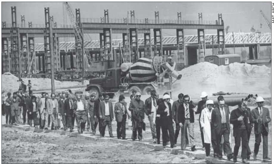
Wizyta przedstawicieli środowisk twórczych na budowie FSM – maj 1973 r.

Łącznie Fiat wyprodukował 3 mln 318 tys. 674 maluchów. Ostatni zjechał z linii produkcyjnej w 2000 roku. Do marca 2006 r. z fabryki wyjechało już 7 milionów aut. Od początku istnienia zakładu w Tychach produkowano Fiata 126p, Uno, Sienę, Palio Weekend, Cinquecento, Seicento, no i chlubę ostatnich lat – Fiata Pandę, który z Tychów jest eksportowany aż do 51 krajów. Dodatkowo montowane były Fiaty Brava, Bravo, Marea oraz Punto. Jak zapowiada dyrekcja FAP, w przyszłym roku ruszy u nas produkcja nowego Fiata 500, a w 2008 nowego Forda Ka. Co za tym idzie, na pewno zwiększy się zatrudnienie w tyskim zakładzie.