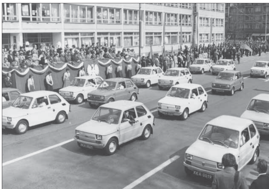
1-majowy pochód rok w Tychach – rok 1976