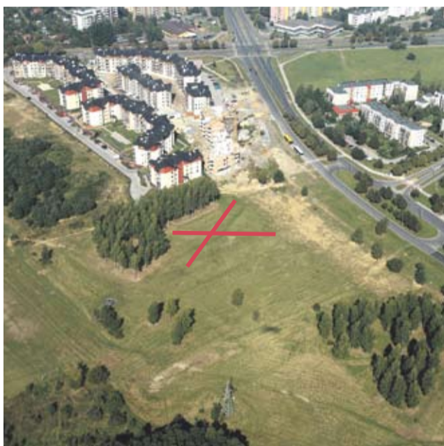
Psi park ul. Sikorskiego.

Która z lokalizacji będzie lepsza dla psiego parku? Zagłosować można na trzy sposoby: