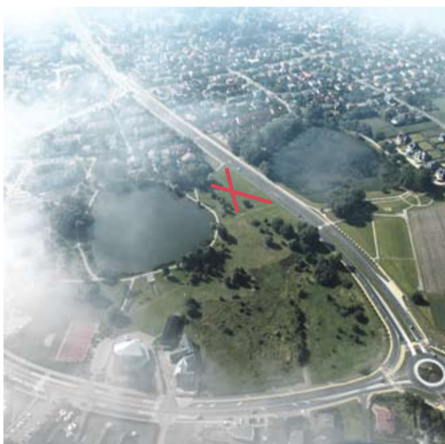
Psi park Suble.

W zeszłym roku Urząd Miasta Tychy rozpoczął kampanię „SKUPMY się na sprawie”, której celem jest walka z plagą psich nieczystości. Najpierw ruszyła akcja edukacyjna w szkołach i przedszkolach, w planach jest zwiększenie dostępu do woreczków na psie kupy i stworzenie w Tychach parku dla psów.