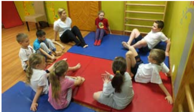
„Trzymaj się prosto” to jeden z programów diagnostycznych skierowanych do dzieci.