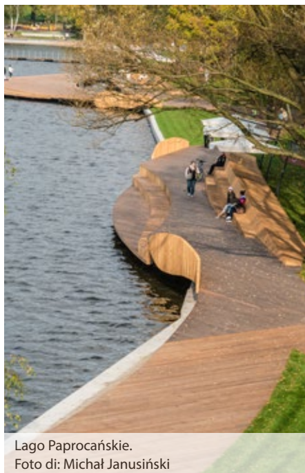
Lago Paprocańskie.

La città è suddivisa in quartieri denominati con le lettere dell'alfabeto che possono essere visitati seguendo uno speciale percorso segnato. Vi invitiamo a fare passeggiate, a visitare e conoscere Tychy. Allo stesso tempo, Vi auguriamo un buon soggiorno nella nostra città.