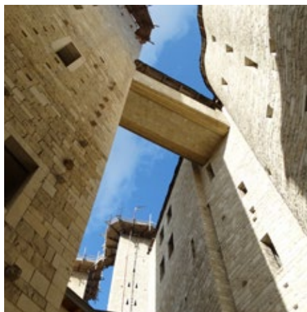
Chiesa di S. Francesco e S. Clara.

Consigliamo di visitare il quartiere Osiedle A, con i suoi attici, i portici, i colonnati. Questi dettagli ispirati allo storicismo sono gli aspetti