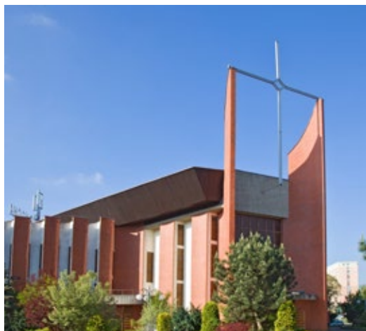
Chiesa di S. Cristoforo.