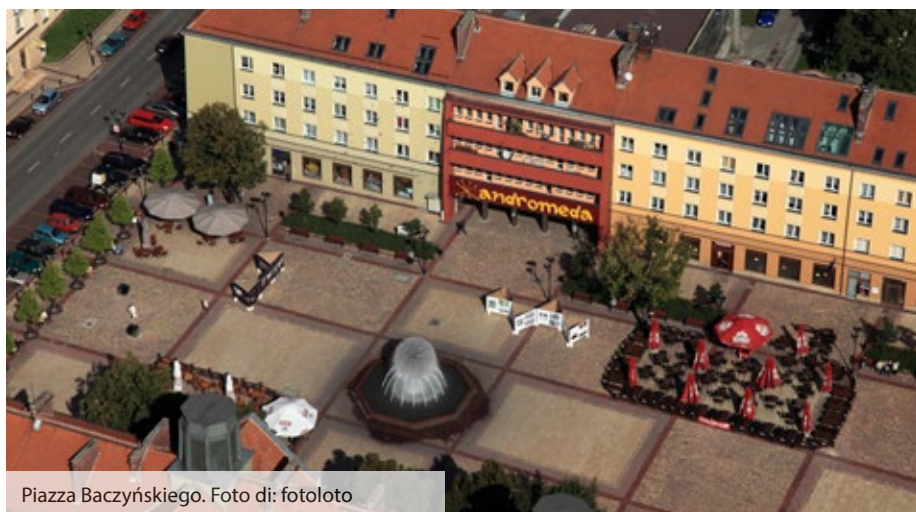
Piazza Baczyńskiego.

Gli amanti della birra conoscono molto bene la birra Tyskie e la Birreria cittadina, risalente al XVII secolo. Oltre alle linee di produzione della bevanda ambrata, la nostra città ospita il museo della produzione della birra "Tyskie Browarium".