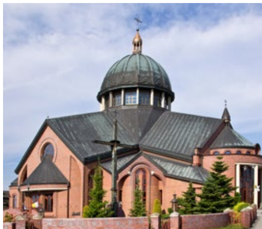
Chiesa della Beata Carolina.