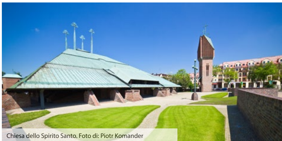
Chiesa dello Spirito Santo.