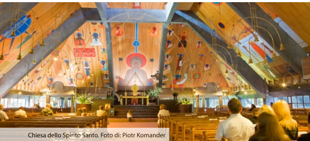
Chiesa dello Spirito Santo.